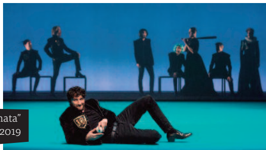
"La bisbetica domata" 8 e 9 febbraio 2019

di Dominique Ziegler con il Théâtre de Carouge - in lingua francese